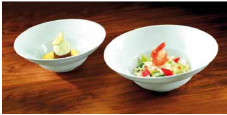
Salatteller 23 cm, Classic Gourmet, extra tief, Inhalt: 0,3 l, Porzellan weiß, Fabr. RAK Art.-Nr. 900.88.27 VE 1 | € 8,85 € 6,10