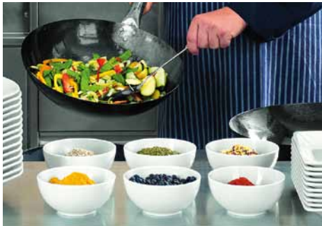
Schale rund 17 cm, Maitre / Modulus, Inhalt: 0,85 l, D = 172 mm, H = 64 mm, Fabr. Bauscher Art.-Nr. 926.01.78 VE 1 | € 3,00