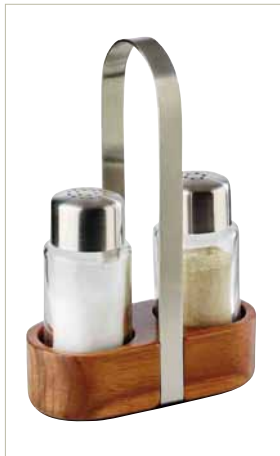
Pfeffer- und Salz- Menage WOOD, Edelstahl, Holz, Maße: 115 x 55 x 170 mm, Fabr. APS

Art.-Nr. 903.59.13 VE 1 | € 16,00 € 12,96